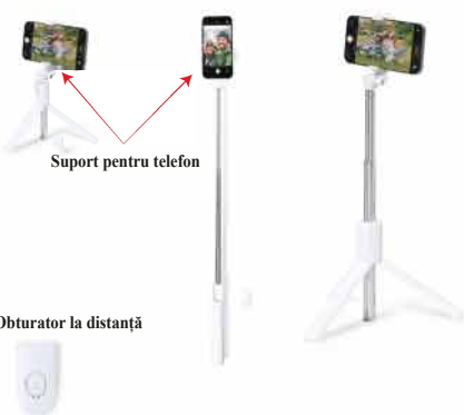
Support pentru telefon