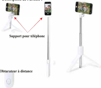
Support pour téléphone